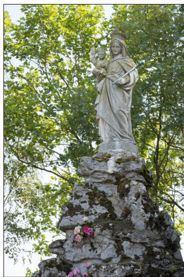
Notre-Dame de Tantelainville

La balade s'est poursuivie jusqu'à l'observatoire du prince Frédéric-Charles.