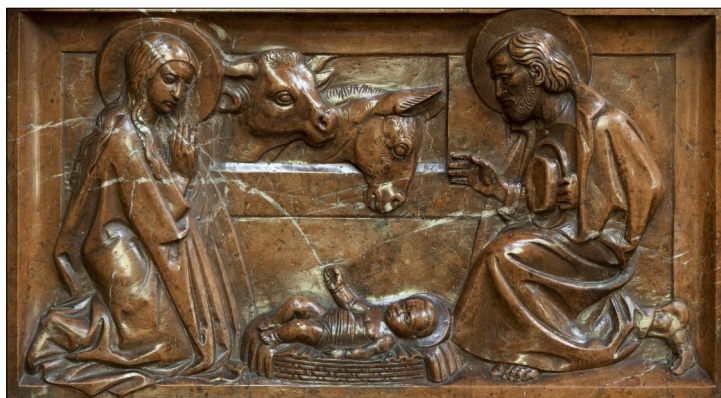
Nativité, autel Notre-Dame de Lourdes. Détail XX e s.