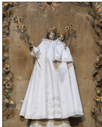
Notre Dame du Bon Secours