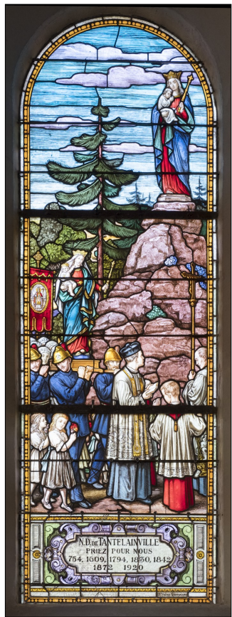
Vitrail de l'église de Vionville

Depuis le monument, Jean-Luc nous raconta les batailles qui eurent lieu en cet endroit et qui vit s'affronter, en août 1870, les armées françaises et prussiennes.